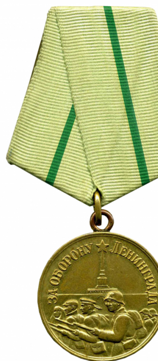
Утвержденная Постановлением ПВС СССР от 12 мая 1943 года

Осенью 1942 года Народный комиссариат обороны обратился с ходатайством в Президиум Верховного Совета СССР об учреждении медалей за оборону Ленинграда, Сталинграда, Севастополя и Одессы. Для медали за оборону Ленинграда было разработано 8 проектов.