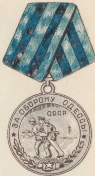
МЕДАЛЬ „ЗА ОБОРОНУ ОДЕССЫ“