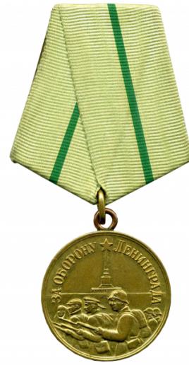
Утвержденная Постановлением ПВС СССР от 12 мая 1943 года

Первое официальное торжественное вручение медалей состоялось 3 июня 1943 года в Смольном, где медалью и удостоверением № 1 был награждён А. А. Жданов. Помимо него медалью были награждены ещё 142 человека.