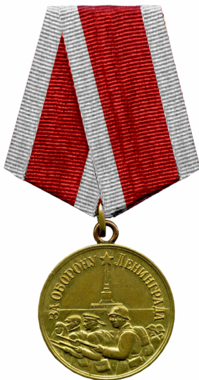
Утвержденная Постановлением ПВС СССР от 27 марта 1943 года