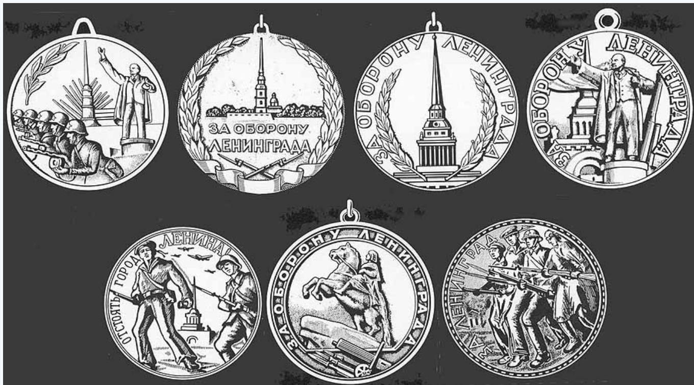
1. Эскиз Н.А. Конгисера 2. Эскиз мастерской «Боробин» 3. Эскиз мастерской «Боробин» 4. Эскиз Б.Г. Бархина 5. Эскиз А.А. Кабакова 6. Эскиз мастерской «Боробин» 7. Эскиз А.А. Кабакова

Эскиз художника Н. А. Конгисера представлял собой изображение шеренги красноармейцев, за спинами которых возвышались Петропавловский Собор и памятник Ленину.