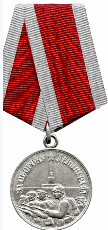
Утвержденная Указом ПВС СССР от 22 декабря 1942 года