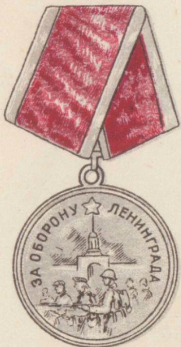
МЕДАЛЬ „ЗА ОБОРОНУ ЛЕНИНГРАДА“