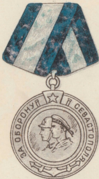
МЕДАЛЬ „ЗА ОБОРОНУ СЕВАСТОПОЛЯ“