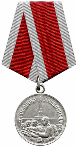
Утвержденная Указом ПВС СССР от 22 декабря 1942 года