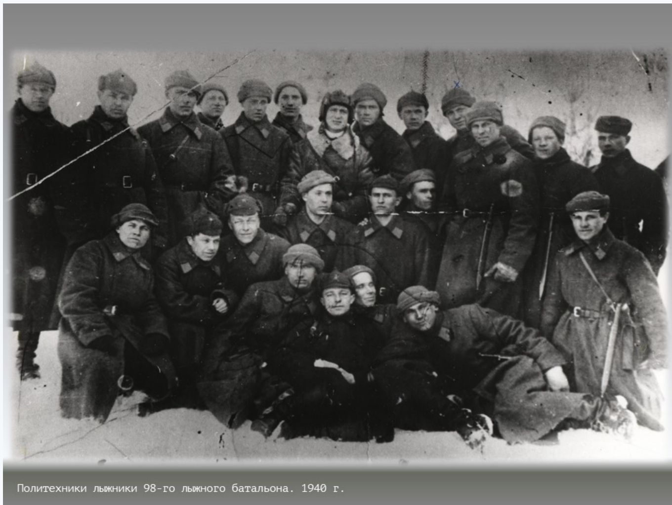
Политехники лыжники 98-го лыжного батальона. 1940 г.

30 ноября 1939 года началась «незнаменитая» советско-финляндская война. 1 декабря 1939 г. институтская газета «Индустриальный» писала о многолюдных митингах, прошедших в стенах вуза днем ранее. На них работники и студенты института восторженно приветствовали решительные действия советского правительства и героическую Красную Армию.