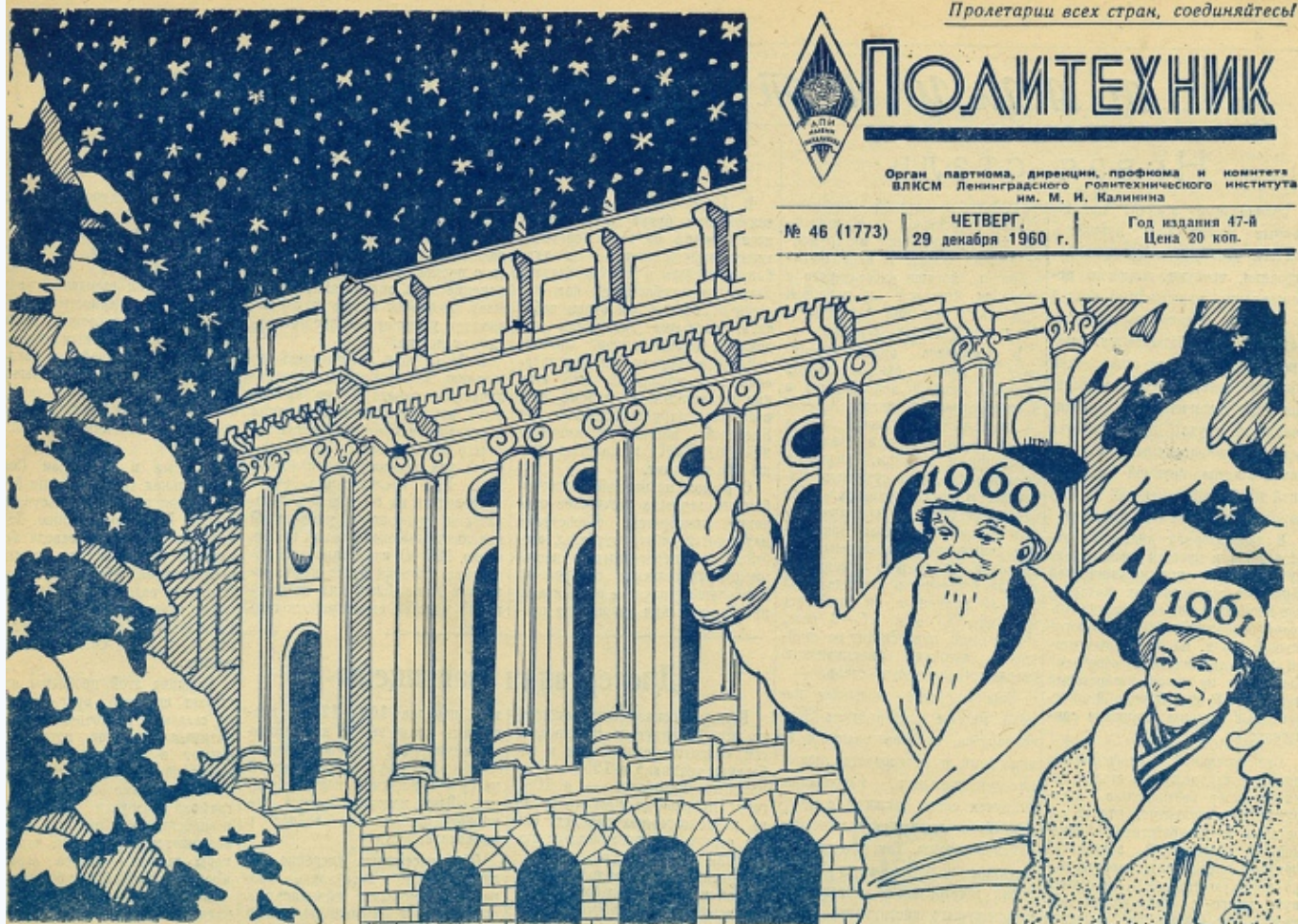
Плакат студента Юрия Киселева

Перемещаемся на 10 лет вперед и погружаемся в атмосферу начала 60-х с пожеланиями от служащей ЛПИ Н. Файнберг: